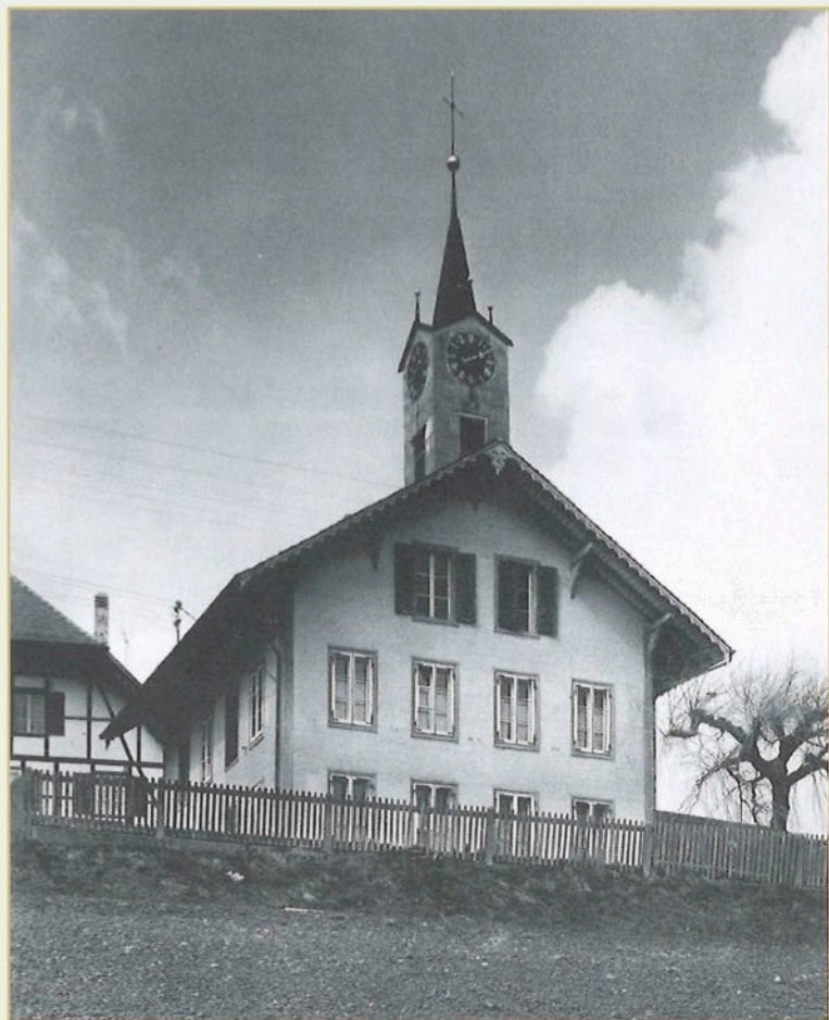
Türmischulhaus von 1873; abgebrochen 1960