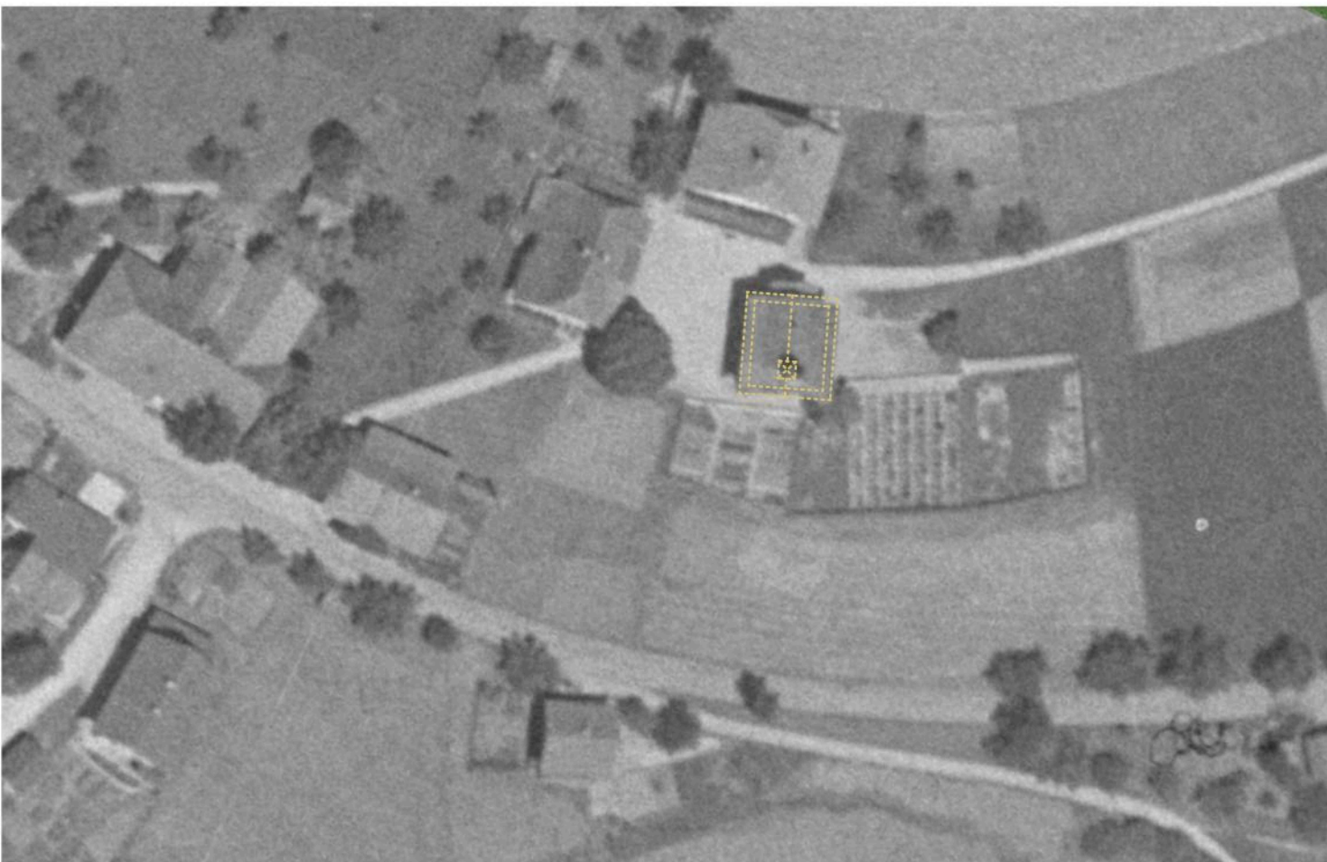
historisches Luftbild 1953