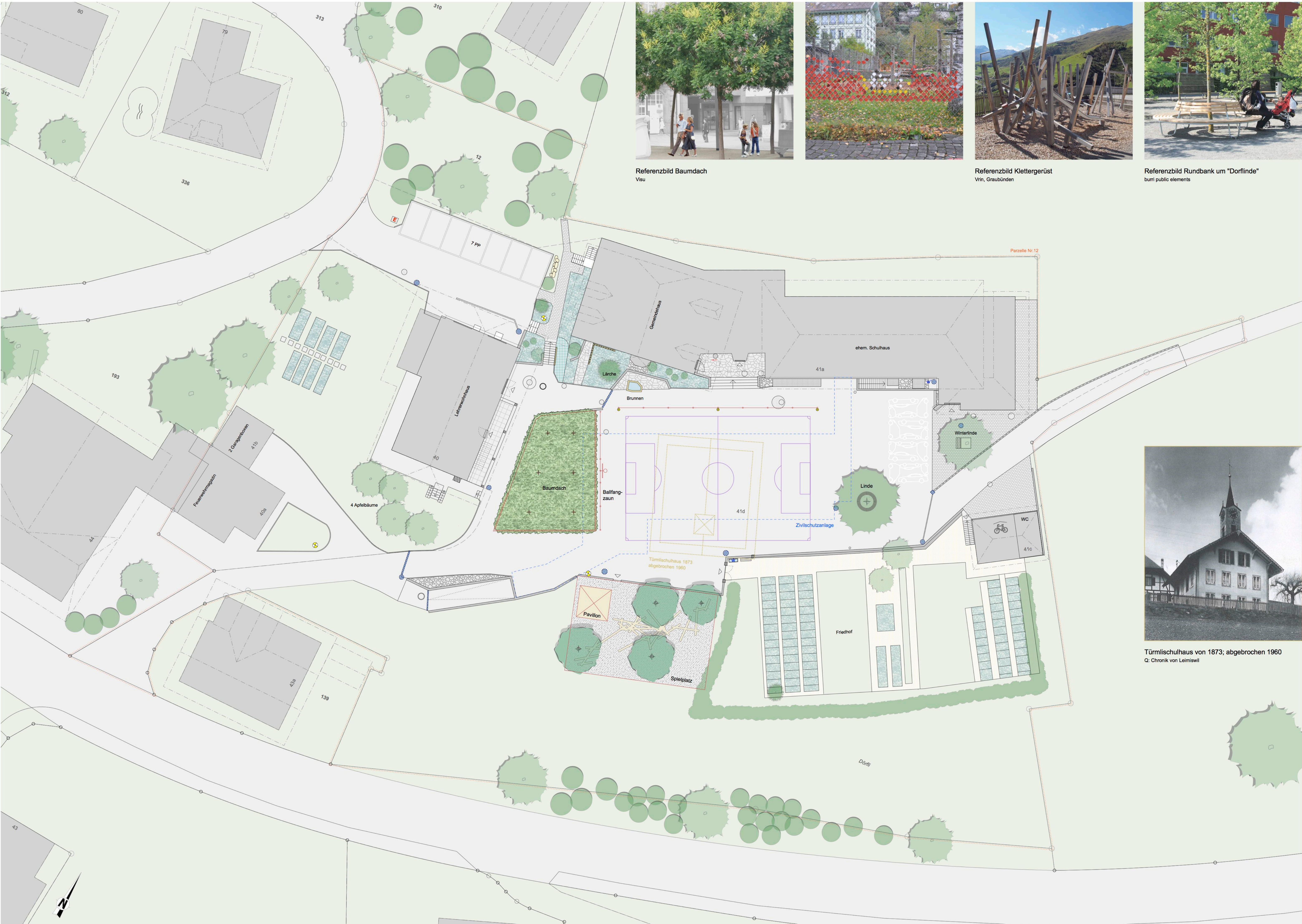
Referenzbild Baumdach Visu